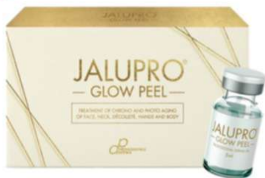
ジャルプログロウピール (グロウピール)